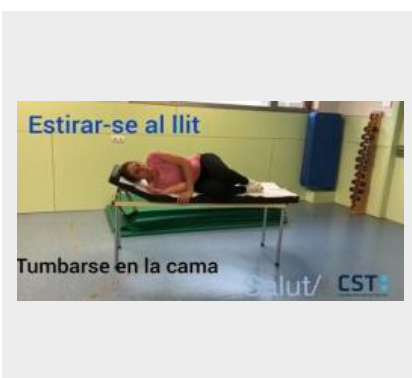
cura postural transf