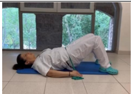
FER EL PONT

Fer, sempre, els exercicis sense dolor, amb l'esquena ben dreta i les espatlles enrere. Realitzar 2 sèries de cada exercici i 10 repeticions a cada serie. Repetir-los 2 vegades al dia (matí i vespre) a ser possible.